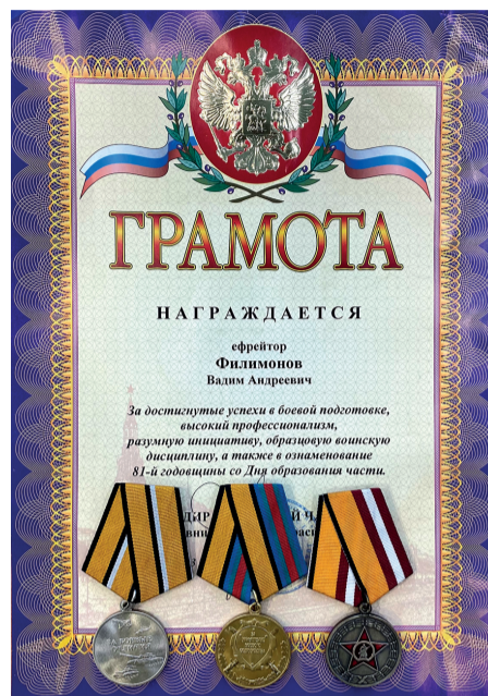
Боевые награды Вадима Филимонова

23 февраля, уже по возвращении на службу, Вадим получил ещё одну медаль. Во время своего двухнедельного отпуска он почитался с родными и близкими,