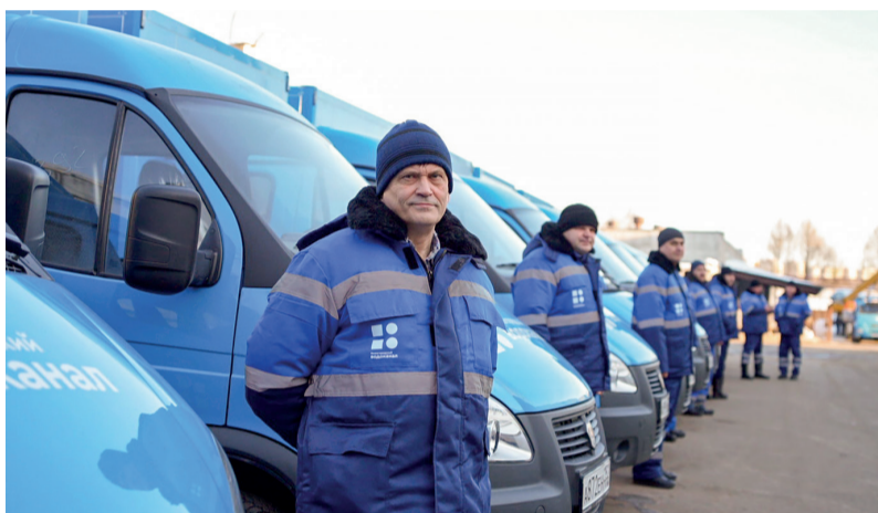
Перед выходом на линию – вручение ключей водителям