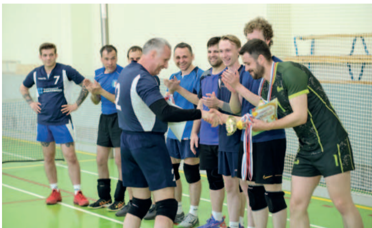
Участие в соревнованиях сплотило команду

Команда АО «Нижгородский водоканал» заняла первое место в финале Первой лиги товарищеского корпоративного турнира по волейболу на кубок АО «Промис».