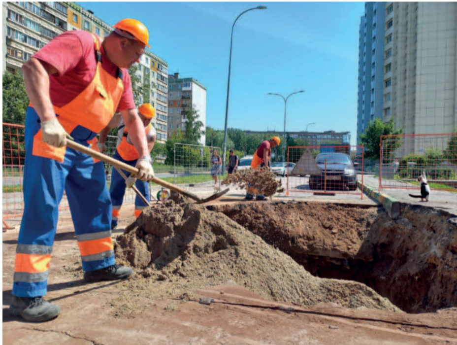
Благоустройство на улице Богдановича

«Асфальтовое покрытие на проезжей части центральных и районных дорог мы восстанавливали