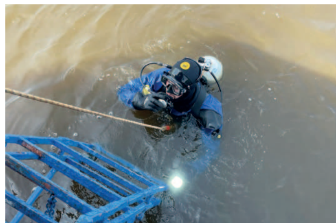
Плановое погружение для проверки состояния оголовков