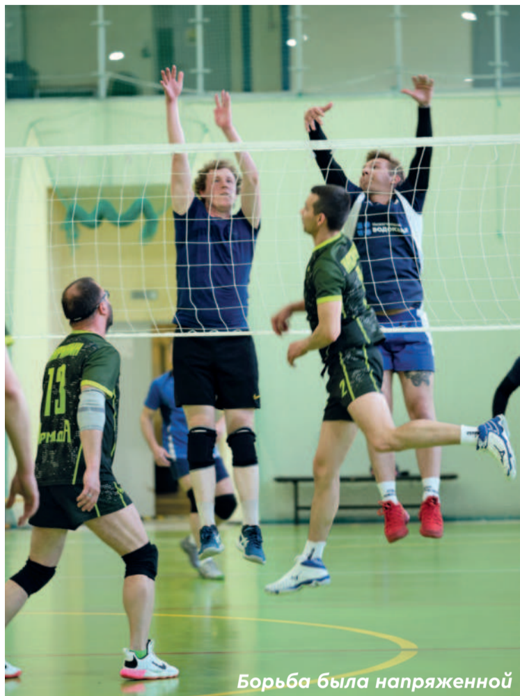
Борьба была напряженной

Участие в товарищеском корпоративном турнире по волейболу на кубок АО «Промис» команда АО «Нижгородский водоканал» принимает уже не в первый раз. В прошлом году волейбольная команда водоканала участвовала во Второй лиге. По итогам завершившихся в декабре 2022 года зимних соревнований Второй лиги товарищеского корпоративного турнира по волейболу на кубок АО «Промис» команда Нижегородского водоканала тогда заняла первое место. В этом году настало время выигрывать в Первой лиге.