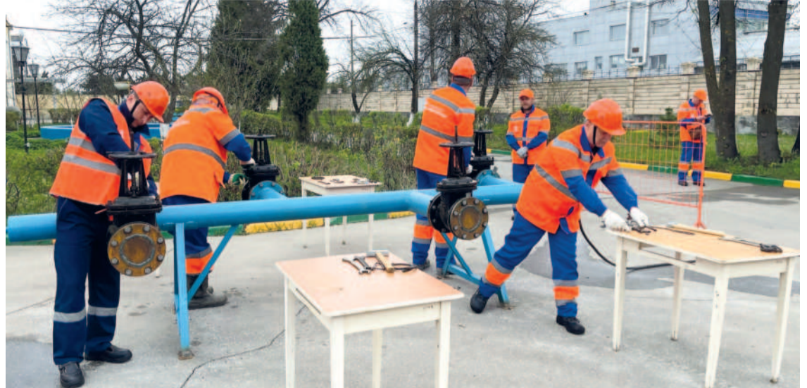
Практическая часть соревнований в самом разгаре

Участниками соревнований стали 15 слесарей аварийно-восстановительных бригад