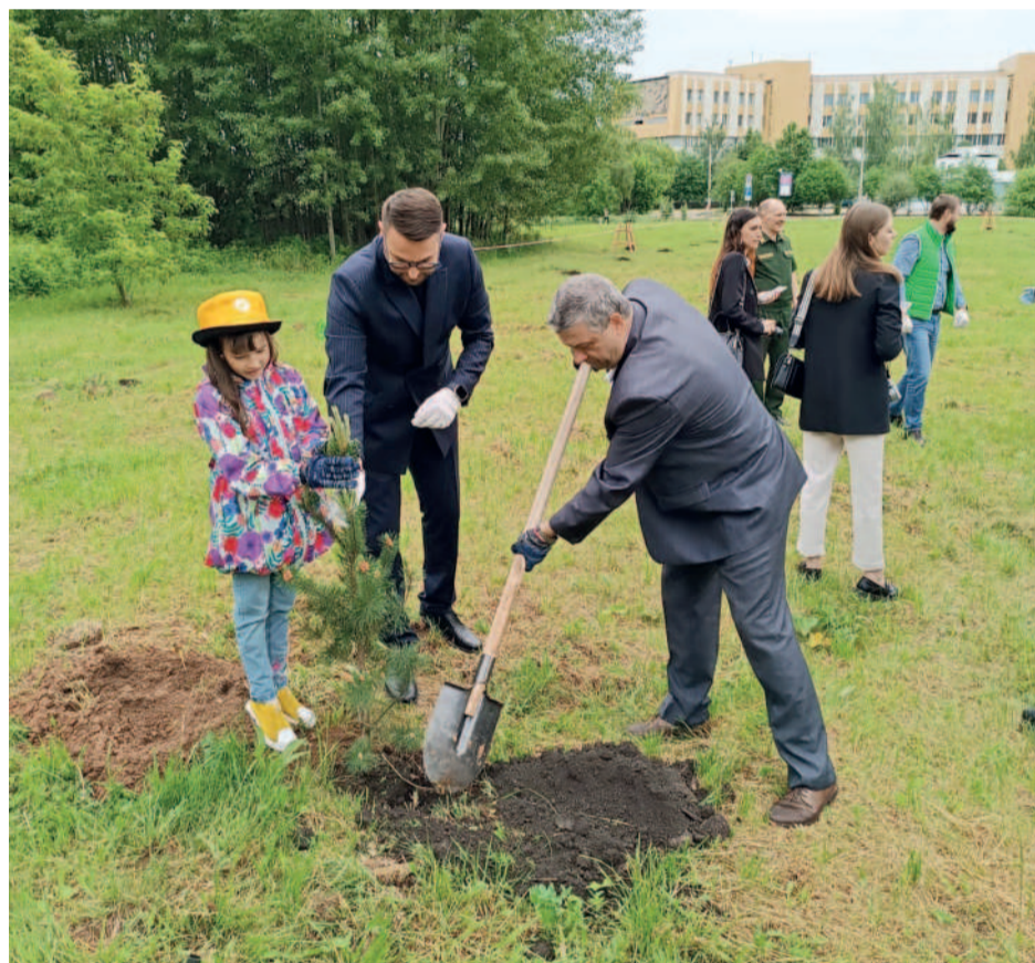
Дети сотрудников водоканала тоже помогли сажать деревья