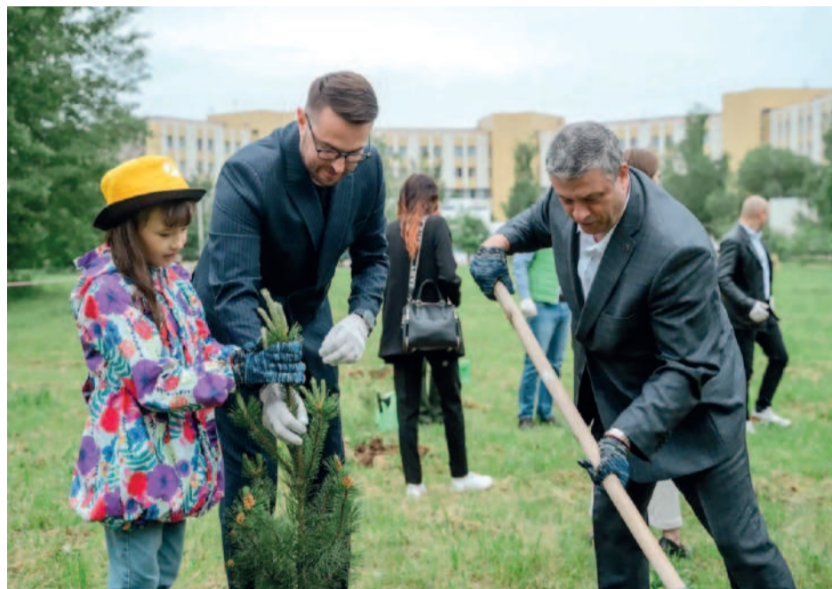
Высадка аллеи в Верхних Печерах