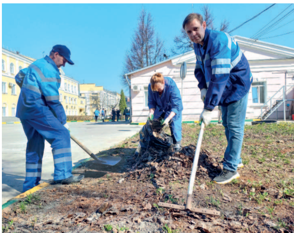
Субботник на Слудинской водопроводной станции