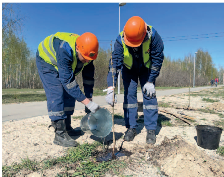
Высадка подрядчиком сирени в посёлке Сортировочный