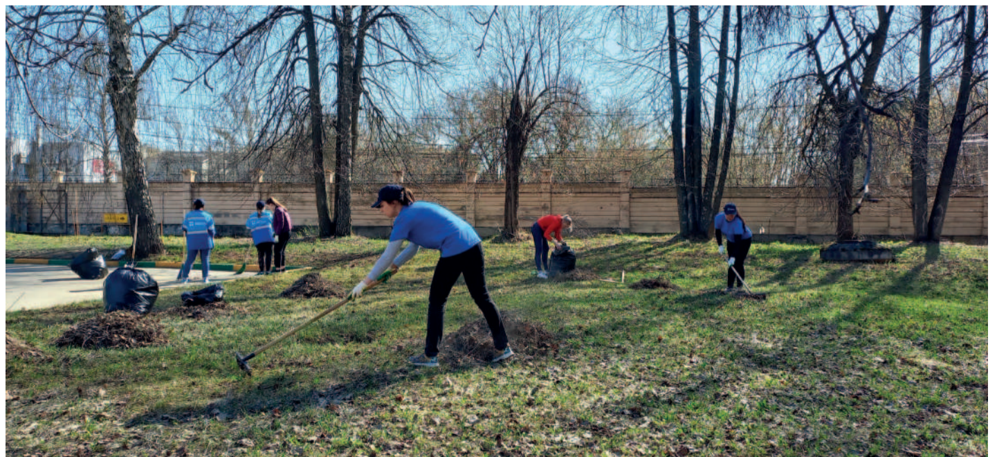
Субботник в самом разгаре. Уборка листьев