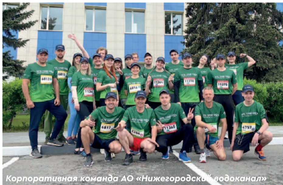
Корпоративная команда АО «Нижегородский водоканал»

фон целиком, восемь человек – дистанцию в 10 километров, остальные водоканальцы пробежали по 5 километров. После мероприятия мы попросили одного из трёх сотруд-